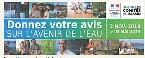
Bannières web, articles types... Besoin d'outils : sdage@eau-loire-bretagne.fr