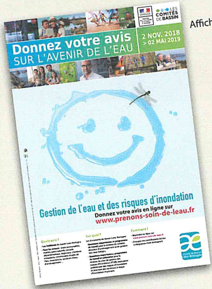
Affiche 40 x 60