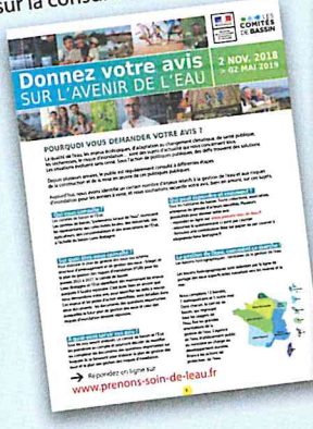
Notice d'information sur la consultation