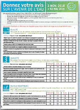
Le questionnaire détachable